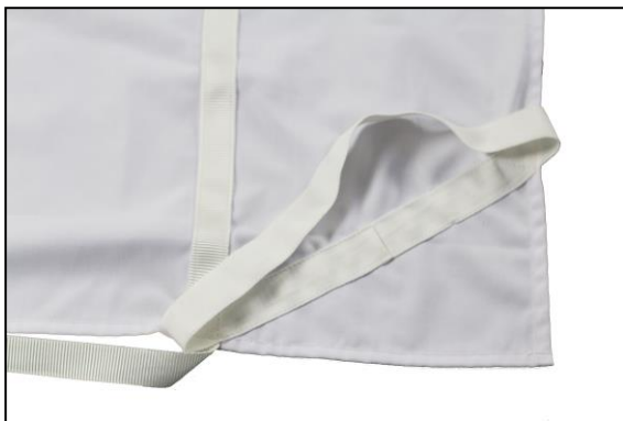
Eckbänder für jede Matratzenhöhe