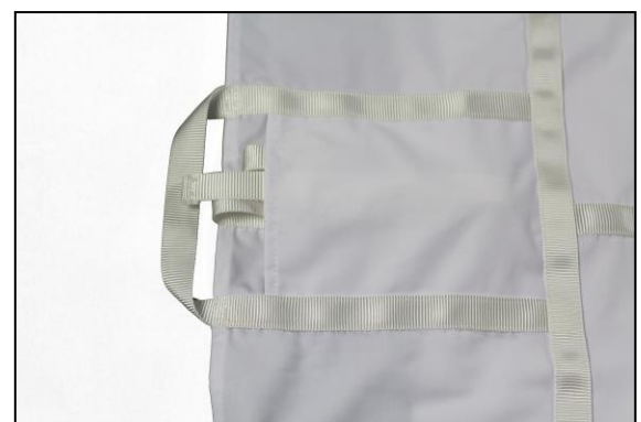
Schnallen in Taschen